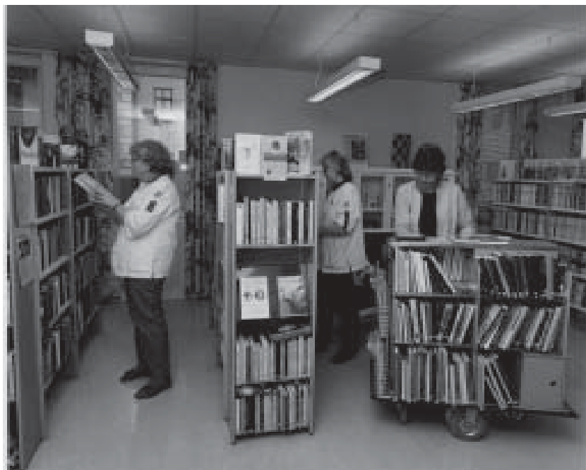
Sjukhusbiblioteket är en integrerad del av vården. Interiör från biblioteket vid Samariterhemmets sjukhus.

Verksamheten vid Samariterhemmets bibliotek fungerar på likartat sätt som den vid Sjukhusbiblioteket på Akademiska sjukhuset. Den beskrivs därför endast kortfattat här.