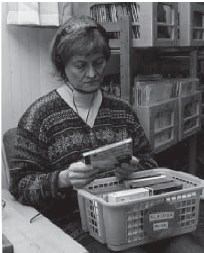
Musiklyssning på Ulleråkersbiblioteket.

Verksamheten vid Ulleråkers bibliotek är liksom sjukhusbiblioteket vid Akademiska sjukhuset och Samariterhemmets sjukhus reglerad genom avtal mellan Akademiska sjukhuset och Uppsala stadsbibliotek. Bilaga 3. Den skiljer sig emellertid på flera områden från den som bedrivs på sjukhusbiblioteket vid Akademiska sjukhuset, varför den beskrivs förhållandevis utförligt här.