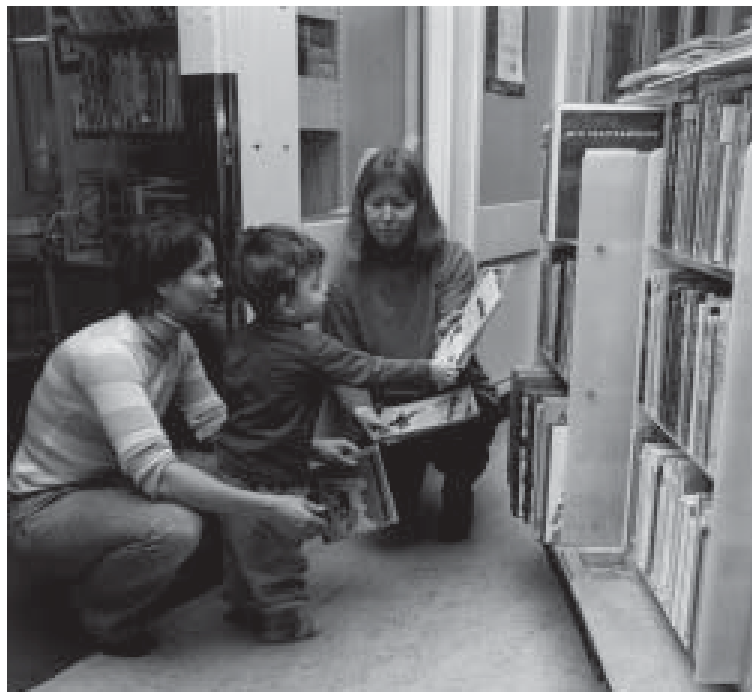
Sjukhusbibliotekets personal besöker varje vecka barnsjukhuset med bokvagn.

I detta kapitel beskrivs sjukhusbiblioteksverksamheten inom Akademiska sjukhusets kärnområde. Några delar av verksamheten beskrivs utförligt som komplement till den information som givits i kapitel 2.