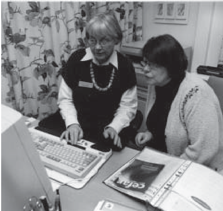
Personalen i Blå rummet informerar patienter och anhöriga om hälsa och sjukdom. Informationssökning i databaser kompletterar muntlig och skriftlig information.

Verksamheten i Blå rummet syftar till att komplettera, stödja samt underlätta förståelsen för den information som har givits av professionen inom vården. Vanliga frågor gäller sjukdomar, behandlingsmetoder eller läkemedel. Det kan också gälla vilka rättigheter patienten har eller uppgifter om patientföreningar och handikapporganisationer.